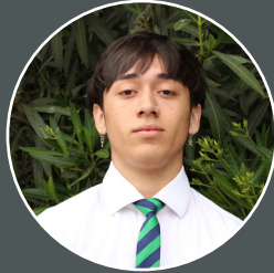
Cristóbal González Diseño Digital INACAP