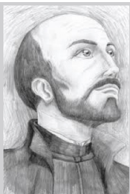
San Ignacio de Loyola

Dios me ama más que yo a mí mismo... ¡Siguiéndote, Jesús, no me puedo perder!