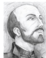
San Ignacio de Loyola